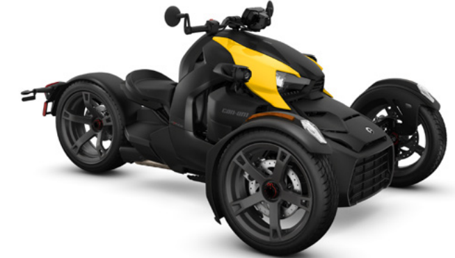
Voertuigen afgebeeld met panelen uit de Classic-serie